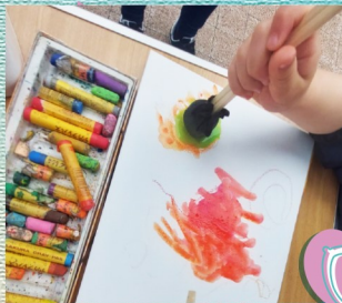
@2kurukuru.art デザイナー2人組によるお絵描きWS