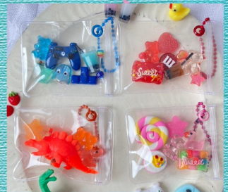
@7.nana.2012 キャンディバックのワークショップ