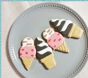
@umisanchi1010 アイシングクッキー販売