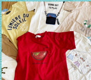
Tentoumushi 有名ブランドこども服アウトレット