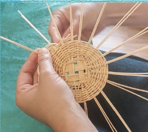
@kousai007 藤編みコースター作り (500円)