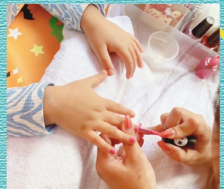
@beautysalon_laki ワンコインキッズネイル (500円)