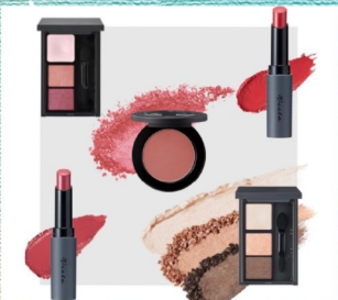
@m.rest413 キスマイク (300円)、ハンドエステ