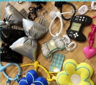
@rora_1.alwaysbeyourself 海の雑貨の販売や、くるみボタンワークショップ