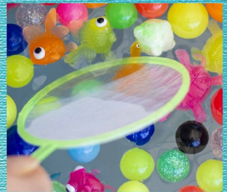
@lions_socialaction スーパーボールすくい