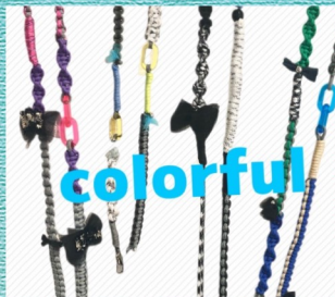
@nna.kyb パラコードと異素材のスマホホルダー